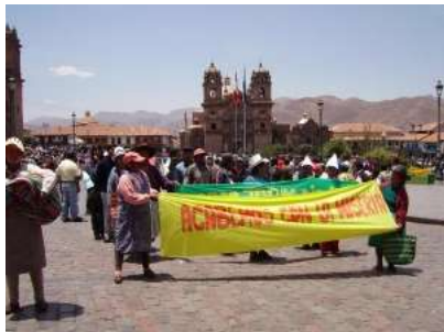
17 października 2006 w Kusko – Peru

Od roku 1987 z inicjatywy Międzynarodowego Ruchu ATD Czwarty Świat organizacje pozarządowe w wielu krajach obchodzą w dniu 17 października Światowy Dzień Sprzeciwu Wobec Nędzy. W 1992 roku Zgromadzenie Ogólne ONZ postanowiło ogłosić ten dzień Międzynarodowym Dniem Walki z Ubóstwem (rezolucja 47/196 z 22 grudnia).